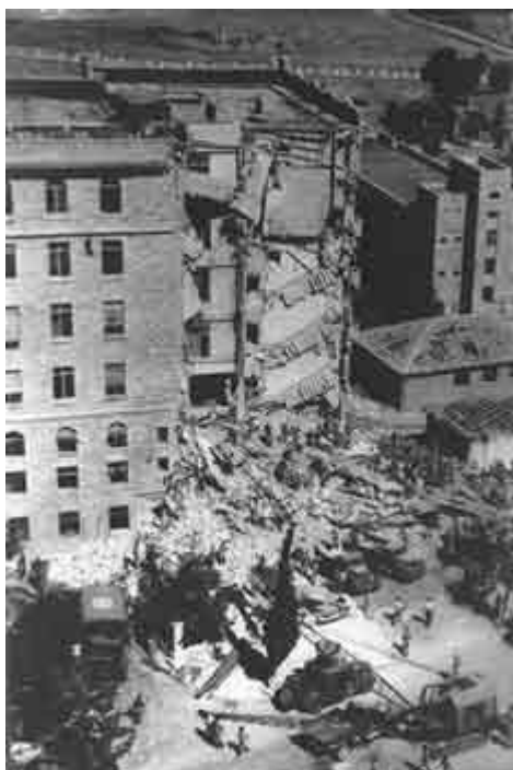
Levo: Terorista BEGIN postao premijer. Desno: Ruševine hotela King David.