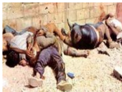
ARIEL "MESAR" SHARON i neke njegove palestinske žrtve