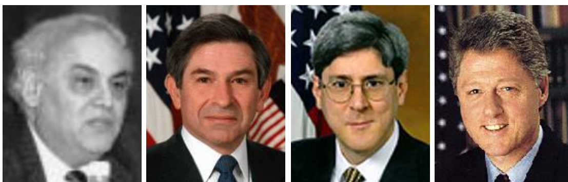
S leva: PERLE, WOLFOWITZ, FEITH, BILL CLINTON. Ratni huškači koji kontrolišu Bušov Pentagon.

Ja bih ovdje mogao da napišem još mnogo toga o cionističkoj moći u bankarstvu, akademskim institucijama, štampanju knjiga, međutim, želio bih da se vratim na one "vesele Izraelce". Jesam li već do sada objasnio što sam htio da kažem?