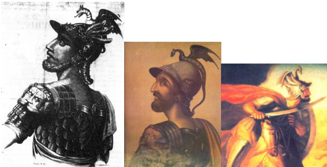
Detalji sa uniforme zmajskog viteza prisutni su na svim ilustracijama Obilića.

Pripadnost redu mu se pripisuje i zbog njegova dva legendarna „pobratima“, Toplice i Kosačića, koji su ponekad sa njime prikazani kao trio u istovetnim uniformama.