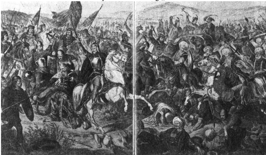
Obilić juriša sa zmajem na šlemu