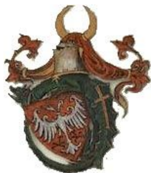
Na grbu Lazarevića je jasno vidljiv i grb reda

Sin kneza Lazara bio je čuveni vitez svog vremena. Tvrdi se da je imao vitešku školu koju je pohađao čak i nemački pesnik Oswald von Wolkenstein. Bio je navodno visok daleko preko dva metra i predstavljao je impresivnu pojavu na bojnopolju. Bio je jako cenjen kako na domaćoj tako i na stranoj političkoj sceni. Smatra se ktitorom Beograda, koji je dobio od kralja Sigismunda u zapuštenom stanju da bi od njega napravio blistavu belu tvrđavu. Bio je počasni član tadašnje mađarske vlasti i vrlo aktivan u obe zemlje. Pre smrti 1927. za svog naslednika odabrao je Đurđa Brankovića, takođe pripadnika reda. Važio je za veoma učenog čoveka i oprobao se i u pisanju. Sa Sigismundom ga je, osim prijateljstva i viteškog bratstva povezivala i legendarna ljubav prema ženama po kojoj su obojica bili čuveni.