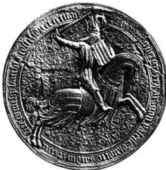
Pećat kralja Aragonije i konta Barselone, Don Martina I, 1399.

Što se dublje zalazi u detalje u vezi sa ovim dokumentima, teže je otarasiti se poređenja tih „Srpskih Rudara“ sa „Engleskim Zidarima“, t.j. navodnim pretečama današnjih Slobodnih Zidara. Neobična važnost i nedorečenosti u vezi sa Zakonom o Rudnicima podjednako su čudni kao ezoterijsko/filozofska učenja koja su se, ničim opravdano, navodno odjednom stvorila na radovima zidarskih esnafa. Objašnjenje da su plemići i intelektualci osetili toliku fascinaciju mazanjem maltera na komade kamena da su stajali u redu za počasni prijem u zidarske esnafe podjednako je smešno kao i umešanost vitezova i najvećih ličnosti iz tadašnje srpske diplomatije i prava za rudarstvo.