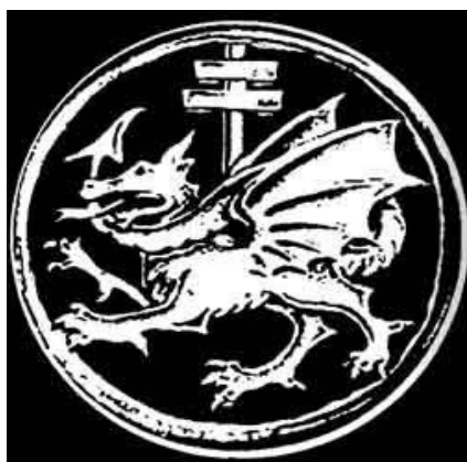
Voštani pečat reda

Oficijelni „plameni“ krst reda. Kaže se da svaki plameni jezičak predstavlja određenu vitešku vrlinu (kao što je slučaj sa 8 špiceva na Malteškom Krstu)